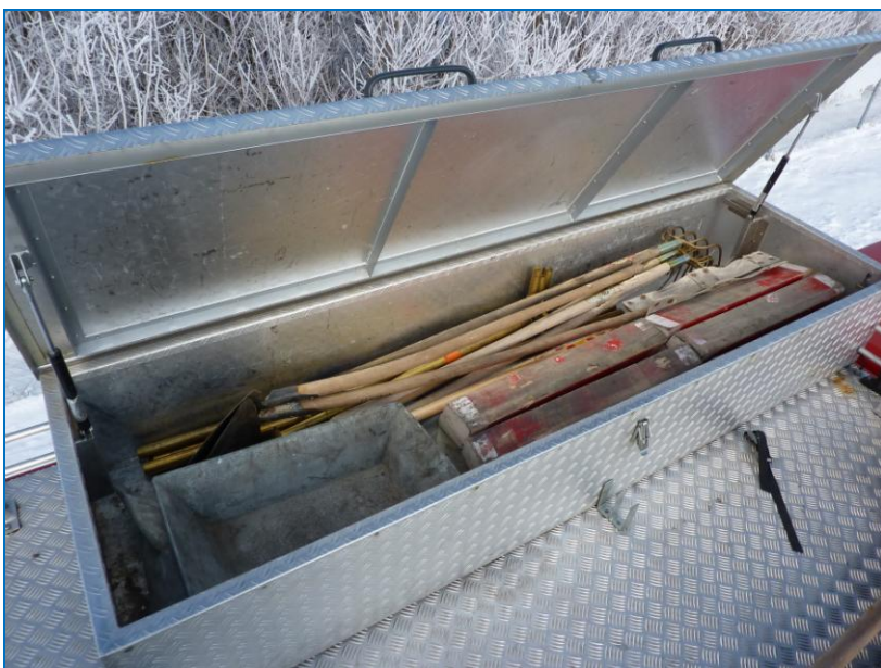
Dachkasten, linke Fahrzeugseite